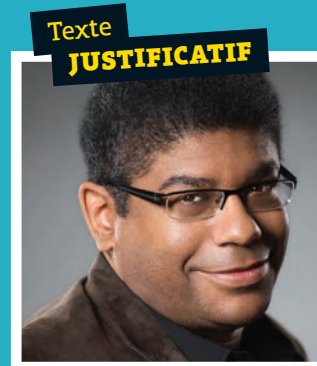
Stanley Péan un critique et un auteur de métier