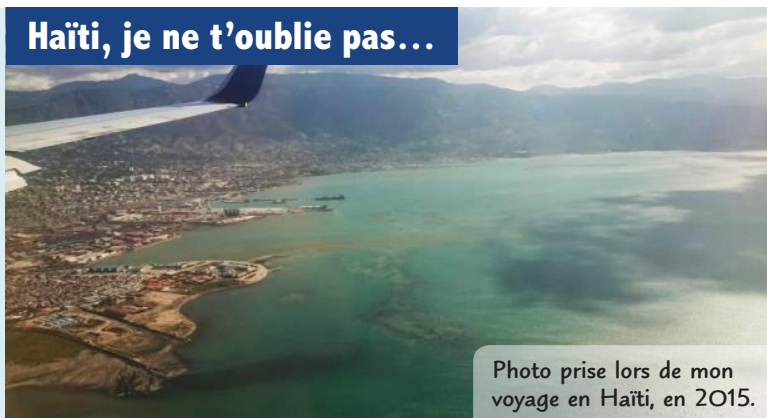
Photo prise lors de mon voyage en Haïti, en 2015.

J'ai visité Haïti pour la première fois à l'âge de 9 ans. La culture noire et haïtienne a toujours fait partie de mon univers. Je retourne dans mon pays natal avec plaisir, mais je dois avouer que je suis parfois découragé par les conditions de vie difficiles de la population.